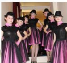
Образцовая студия «Ровесница» Эстрадный вокал г. Челябинск