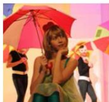
Театральный коллектив «Зеркало» Актерское мастерство г. Челябинск

ГЛАВНАЯ ДЕТСКАЯ ПРЕМИЯ В ОБЛАСТИ ИСКУССТВА 5 лет Премия «АНДРЮША-2014» ПАМЯТИ АНДРЕЯ ЖАБОТИНСКОГО