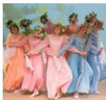
Ансамбль танца «Эридан» Народный танец г. Челябинск